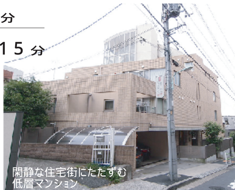
閑静な住宅街にたたずむ 低層マンション