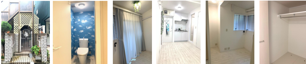
※図面と現況が異なる場合は、現況優先とします。

白を基調とした明るいお部屋です。 9.5帖と広くお気に入りの家具がおけます！ 収納も大きくたくさんの荷物が入ります(^-^)/