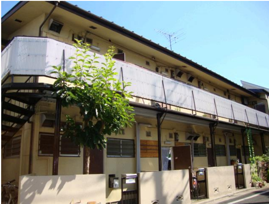
※図面と現況が異なる場合は、現況優先とします。

心身ともに癒される和室空間(^_^)/ 蘭草の香りは心を落ち着かせてくれます キッチンスペースが独立していて使い勝手の良いお部屋！