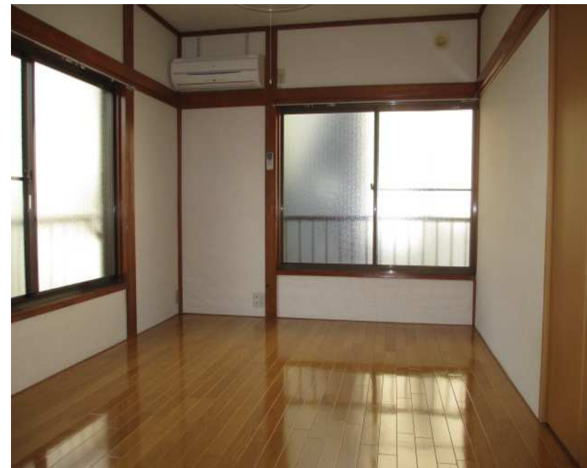
女性限定 1K 20㎡