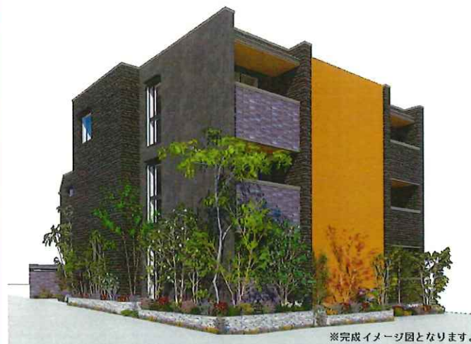
※完成イメージ図となります。