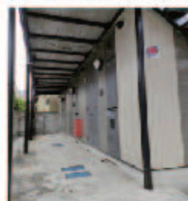
玄関・室内収納充実!!