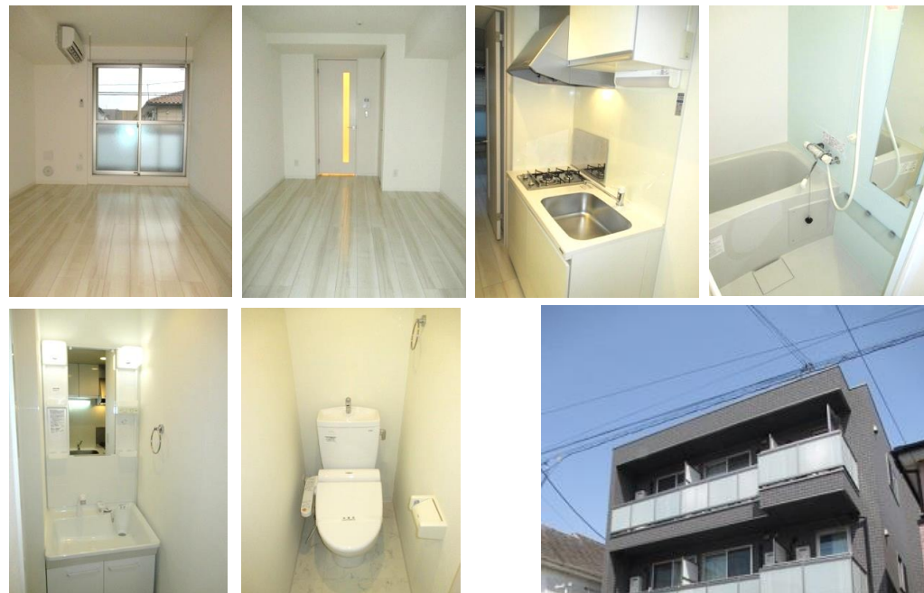
※同タイプの写真です