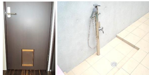
ペット出入口付 室内ドア