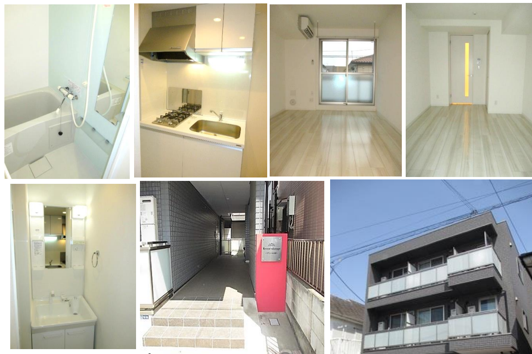
※写真は202号同タイプ