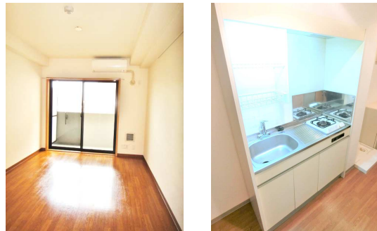
写真は同タイプ別部屋