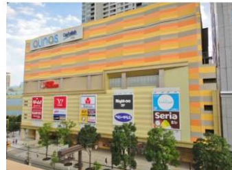
オリナスまで徒歩1分