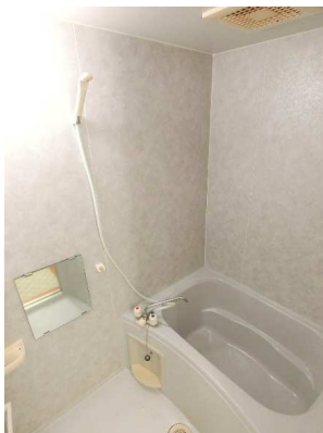
※写真は別部屋参考写真